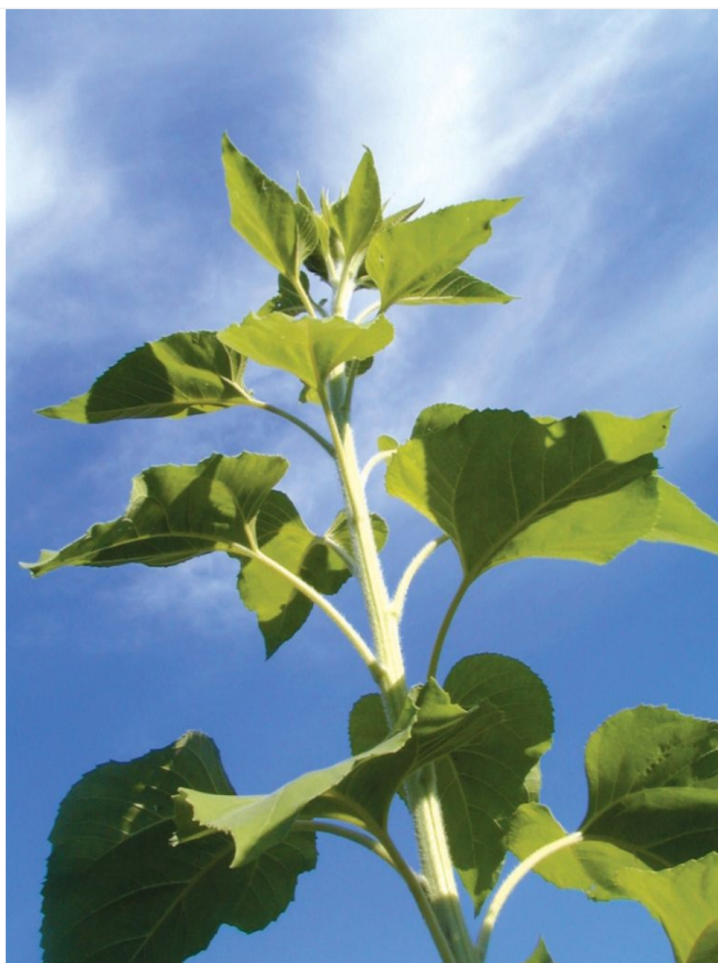
L'angle entre les feuilles successives de la tige de ce tournesol est très proche de 137,5^\circ

possible. Cette distribution "intelligente" permet une optimisation de la photosynthèse tout en maximisant la croissance de la plante.